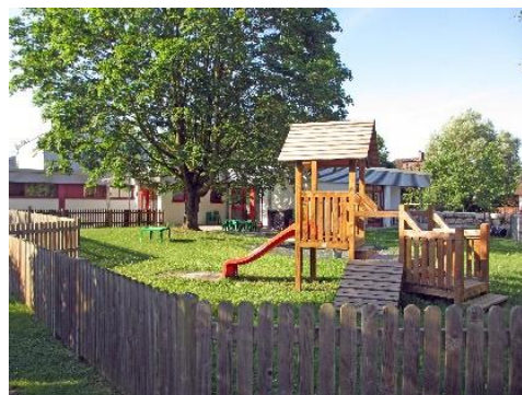
Klettergerüst im Aussenbereich