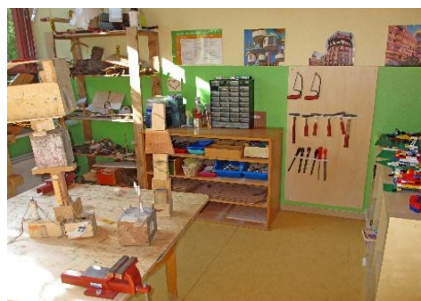
Werk- und Bastelraum

Die Einrichtung versteht sich als Bildungsstätte, die sich an den spezifischen, altersstrukturell bedingten Bedürfnissen der Kinder orientiert, ist es doch erwiesen, dass die ersten Lebensjahre die lernintensivste Zeit im menschlichen Leben sind.