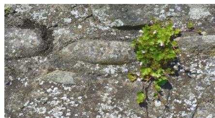
Zimbelkraut an der „alten Mauer“

Pfarrer Frühe war 34 Jahre alt, als im Jahr 1790 die Niederbühler Kirche einstürzte. Sie wurde 90 Jahre zuvor von französischen Truppen niedergebrannt. Sie konnte nur notdürftig aufgebaut werden.