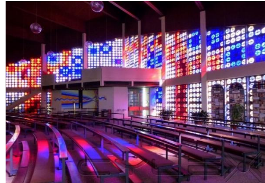
Morgenlicht „verzaubert“ den Innenraum

Gleichzeitig wurden wertvolle Gegenstände von der „alten“ Kirche wie z. B. die Monstranz aus dem Hochmittelalter, Statuen und Bilder sowie das wohl wertvollste Kleinod Rastatter Orgelbaukunst, die Stieffel-Orgel , integriert.