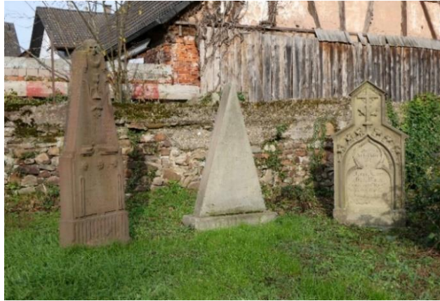
Grabmale auf dem „Alten Kirchplatz“

Pfarrer, Wirt, Ökonomieverwalter oder Oberförster.