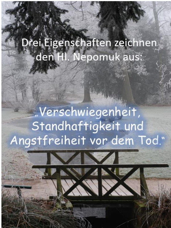
Winter im Schlosspark zu Favorite Förch

Die im 16./17. Jahrhundert entstandene Nepomuklegende berichtet überdies, dass Johannes Nepomuk der Beichtvater der Königin war und von König Wenzel dazu gedrängt wurde, das Beichtgeheimnis zu brechen.