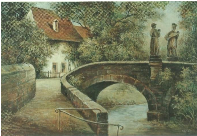
Zweibogenbrücke aus dem Jahr 1755

Seit fast 300 Jahren überqueren Fußgänger und Fahrzeuge der verschiedensten Art den Ooser Landgraben über die aus Sandstein errichtete zweibogige Brücke beim Gasthaus Schwanen. Diese wurde 22 Jahre nach dem Tod von Markgräfin Franziska Sibylla Augusta (geb. 1675, gest. 1733) im Jahr 1755 fertiggestellt und ersetzte die alte Holzbrücke.