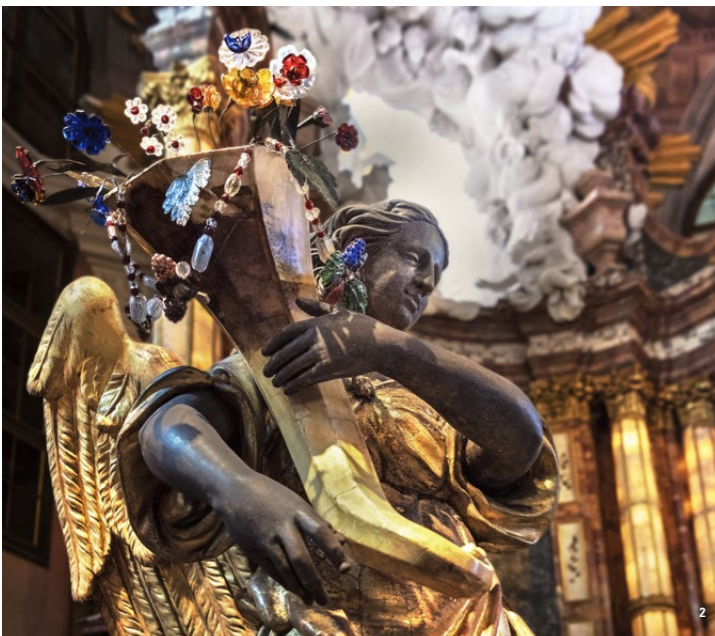
👑 Zur kostbaren Ausstattung gehören Engel mit Glasblumen und zwei Heilige Leiber (rechts)