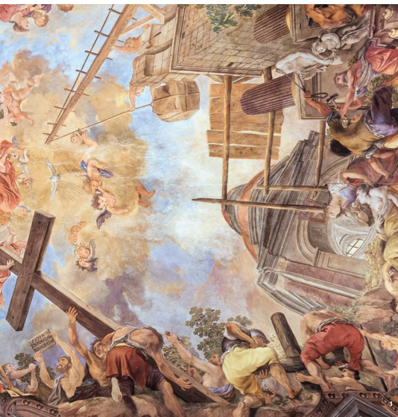
Im Deckengemälde ist Sibylla Augusta als Heilige Helena zu sehen

Im Deckengemälde zeigt sich die Regentina als Heilige Helena bei der Auffindung des Kreuzes Jesu. Mehrere Kopien heiliger Stätten aus dessen Leben vereinen sich in dem Bau, unter anderem die Heilige Stiege nach dem Vorbild der berühmten Scala Sancta in Rom . Aus den römischen Katakomben stammen die kunstvoll geschmückten Heiligen Leiber in gläsernen Schreinen. Führungen, Vorträge, Gottesdienste und eine Orgelmatinee laden anlässlich des Jubiläums dazu ein, die Schlosskirche mit all ihren Besonderheiten zu erleben.